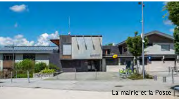
La mairie et la Poste