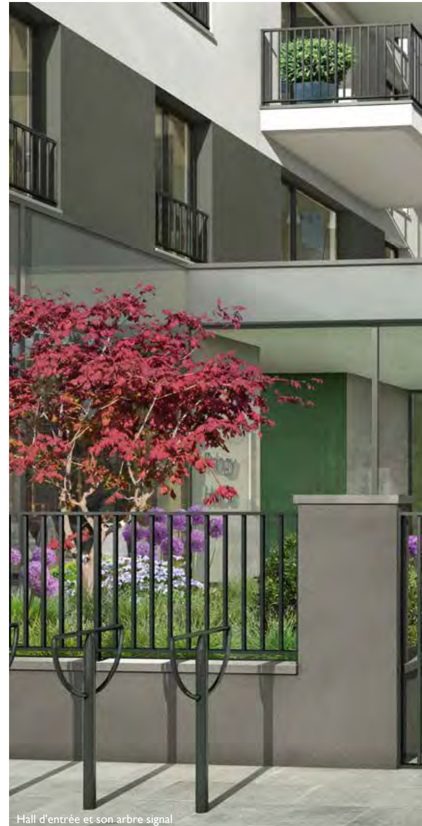
Hall d'entrée et son arbre signal

L'œuvre intègre un arbre majeur, cet espace unique sur le bassin annécien est valorisé par des parements de matériaux nobles comme le marbre.