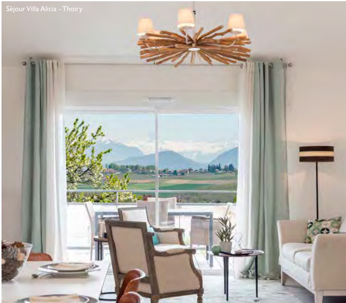
Séjour Villa Alicia - Thoiry